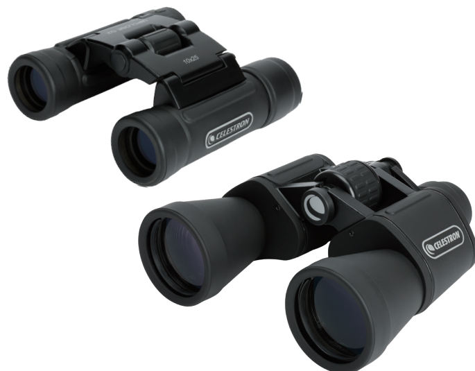
図.1 ダハプリズム 双眼鏡

お使いの双眼鏡に「視度目盛(インジケーター)」がある場合は、設定した数値を覚えておくと、次回から素早く自分に合ったピント調整が可能です。