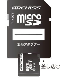
変換アダプターの使い方